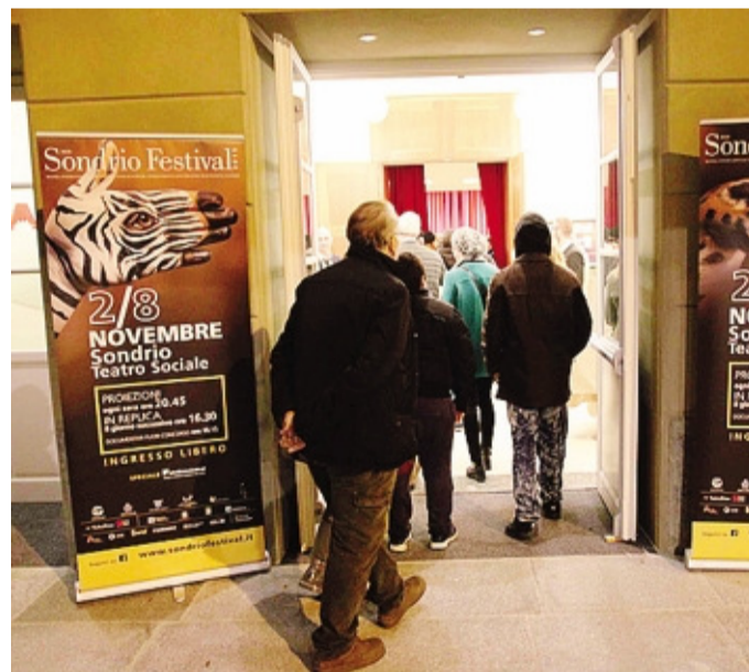
Come lo scorso anno, il Teatro Sociale sarà cuore del Sondrio Festival

Comodamente seduti in poltrona, ci si intrufolerà in punta di piedi in questi paradisi di wilderness, per osservare da vicino specie vegetali e animali, come le volpi, il gigantesco grizzly, le giraffe e l'orso polare, simbolo dell'edizione 2016 insieme al lupo.