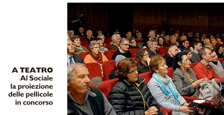
A TEATRO Al Sociale la proiezione delle pellicole in concorso

sfoderata per affrontare le paure. Nuove, arcaiche, incontrollabili, come quella nei confronti del lupo che è tornato a popolare le Alpi. «Sondrio Festival, da sempre, lavora per regalare uno sguardo che non si fermi alla natura, ma sappia leggere dentro il reale quotidiano i meccanismi della società