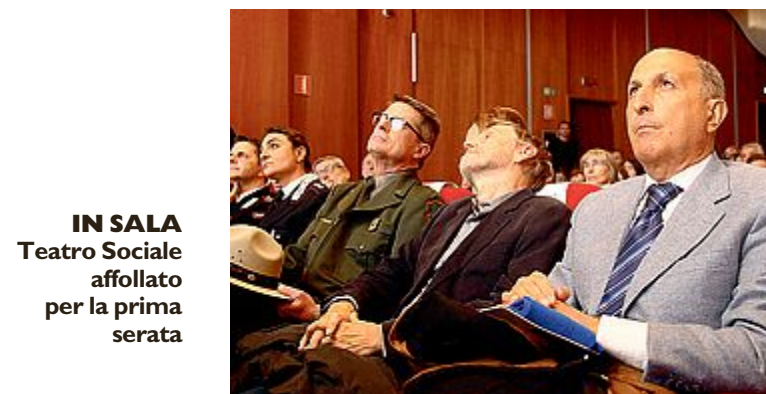
IN SALA Teatro Sociale affollato per la prima serata