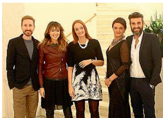
STAFF I protagonisti della rassegna dedicata ai parchi