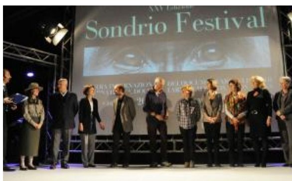
Giuria e registi del Sondrio Festival (foto d'archivio)

La manifestazione sondriese ha raggiunto diversi obiettivi importanti, ma non ha ancora raggiunto quel respiro internazionale che meriterebbe.